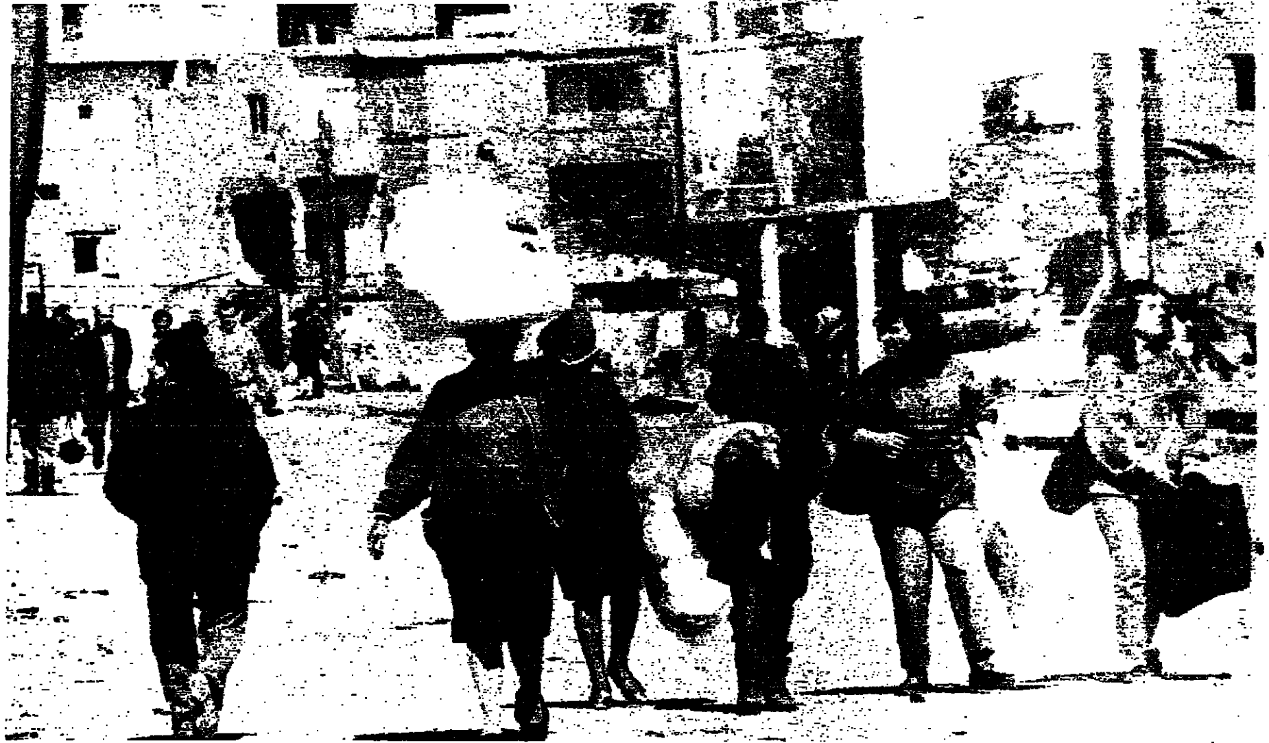
عابرون على معبر الصالومي - النجعة (جوزف فضول، بشارة الشهاب)